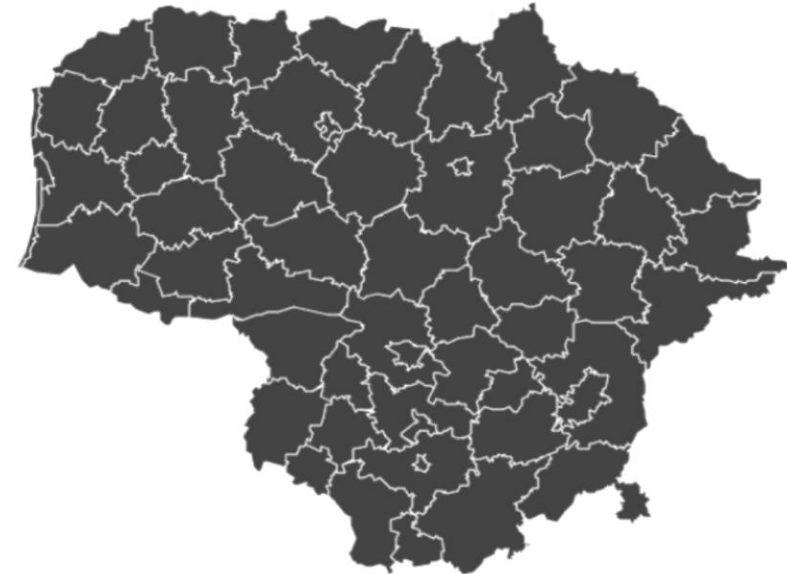
Savivaldybių spalvinės zonos